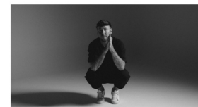
STABFOTOGRAF PATRICK AMOS