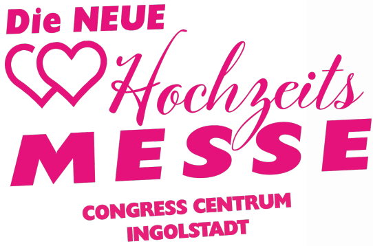
Maritim Hotel Ingolstadt - UG - Foyer Ingolstadt