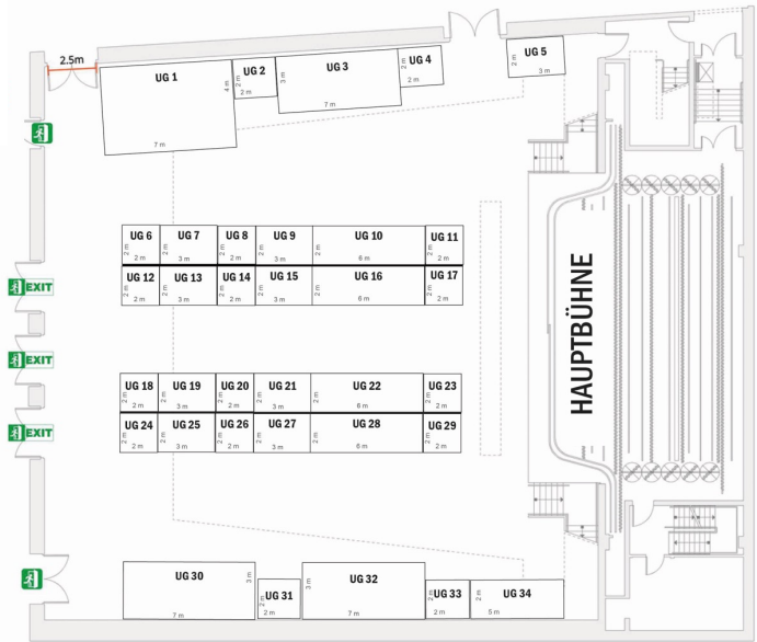
Maritim Hotel Ingolstadt - 1. UG - Saal Ingolstadt

Über 2000 qm Ausstellungsfläche Auf 3 Ebenen!